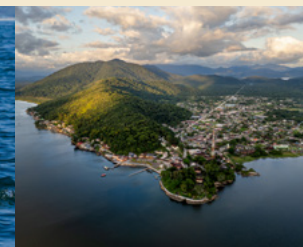
CIDADE DE GUARAQUEÇABA