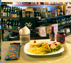
PANQUECA DE SIRI