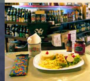
PANQUECA DE SIRI