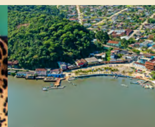
CIDADE DE GUARAQUEÇABA