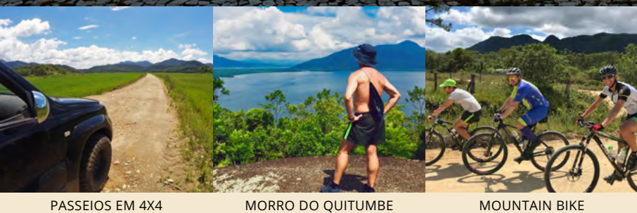
PASSEIOS EM 4X4

@GrandeReservaMataAtlantica www.grandereservamataatlantica.com.br