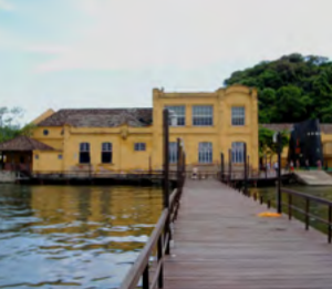
MUSEU DO MAR