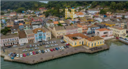
SÃO FRANCISCO DO SUL

A Grande Reserva Mata Atlântica é a oportunidade única para a conservação de uma das áreas mais importantes em biodiversidade do mundo. Ao mesmo tempo, promove uma economia restaurativa, melhorando a qualidade da vida de dezenas de comunidades rurais. A Mata Atlântica é um patrimônio do Brasil e precisa ser valorizada, reconhecida e preservada por todos.