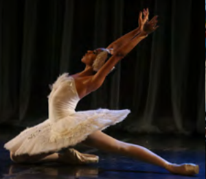
FESTIVAL DE DANÇA