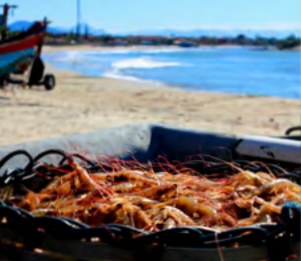
FRUTOS DO MAR