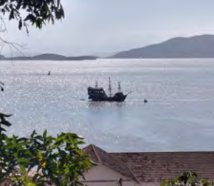
PASSEIO DE ESCUNA